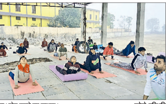
नरवाना। योग करते हुए साधक।