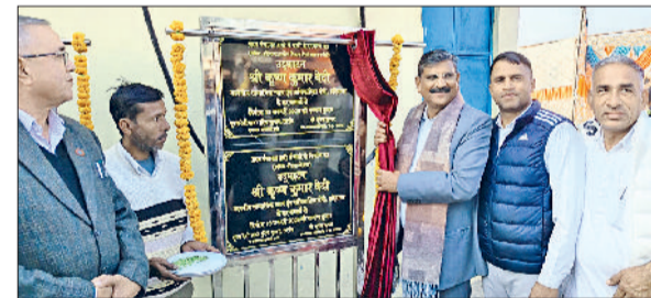
नरवाना। परियोजनाओं की शुरुआत करते हुए मंत्री बेदी।

हरियाणा के सामाजिक न्याय एवं अधिकारिता मंत्री कृष्ण कुमार बेदी ने नरवाना क्षेत्र के विभिन्न गांवों में पेयजल सुविधाओं के विस्तार के तहत बनाए गए बूस्टर स्टेशनों और नई पाइपलाइन परियोजनाओं का उद्घाटन किया। इन परियोजनाओं पर लगभग 8 करोड़ रुपये से अधिक की राशि खर्च की गई है। इनमें जल जीवन मिशन के तहत गांव दनौदा कलां में 2 करोड़ 77 लाख 40 हजार से नव निर्मित बूस्टर स्टेशन नम्बर.2ए गांव हरनामपुरा में 1 करोड़ 64 लाख 37 हजार तथा हथो में एक करोड़ 75 लाख 88 हजार की लागत से बने बूस्टर स्टेशन व पाइपलाइन के विस्तारीकरण का