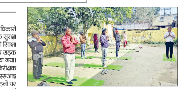
जुलाना। बीबीपुर गांव में योग करते युवा।