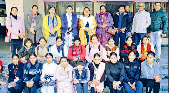
जीद। प्रतियोगिता में भाग लेते हुए।

विष्णुलोक को प्राप्त करेगा शालिग्राम का अभिषेक करने से समस्त तीर्थों में स्नान का फल प्राप्त होता है। विधि-विधान से पूजन करने वाला व्यक्ति करिष्युग में भी विष्णुलोक को प्राप्त करता है। सहस्रों शिलालिंगों के दर्शन और पूजन से जो फल मिलता है, वह शालिग्राम के एक दिन के पूजन से ही प्राप्त हो जाता है। जहां शालिग्राम निवास करते हैं, वहां समस्त देवता और मन्त्राला निवास करते हैं। शालिग्राम के समक्ष किया गया श्राद्ध पितरों को भी कल्पों तक स्वर्ग में वास दिलाता है। शालिग्राम शिला का जल पीने से अमृतपान का फल प्राप्त होता है और जहां शालिग्राम विराजमान होते हैं, वहां तीव्र योजन की परिधि में विद्ये गए।