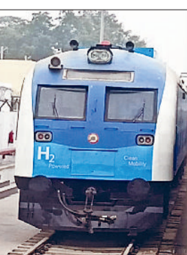
पहले केवल ट्रैक की जांच ही नहीं, बल्कि ट्रेन की कार्यक्षमता, सुरक्षा

देश की पहली हाइड्रोजन ट्रेन चलाने के लिए रेलवे पूरी तरह से तैयारी कर रहा है। पहले उम्मीद थी कि जनवरी के दूसरे सप्ताह तक ट्रायल हो जाएगा लेकिन अभी इसमें कुछ दिक्कतें आ रही हैं। जनवरी महीने के अंतिम सप्ताह तक ट्रायल होने की संभावना है। हाइड्रोजन ट्रेन के संचालन से