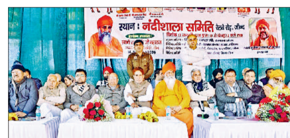
जीद। कार्यक्रम में मंच पर मौजूद मुख्यातिथि। फोटो: हरिभूमि

जीद। कार्यक्रम को संबोधित करते राज्यसभा सांसद सुभाष बराला। फोटो: हरिभूमि