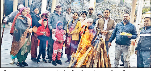
जीद। बाल उपवन आश्रम में लोहड़ी पर्व मनाते हुए अधिकारी व स्टाफ सदस्य।