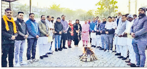
कैथल। भाजपा कपिल कमल कार्यालय में लोहड़ी का पर्व मनाते पदाधिकारी।