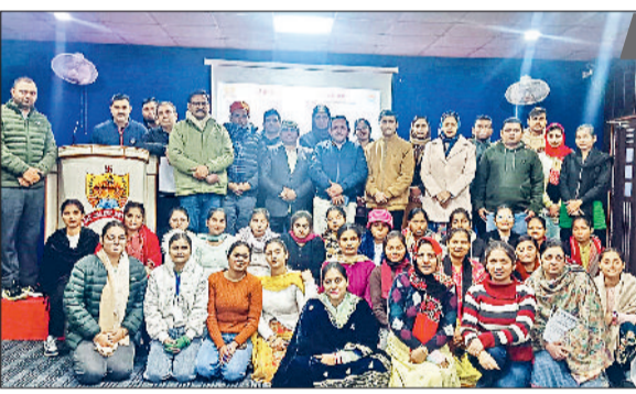
कैथल। जाट बीएड कॉलेज कैथल में कार्यशाला के दौरान संस्थान के पदाधिकारी तथा विद्यार्थी।