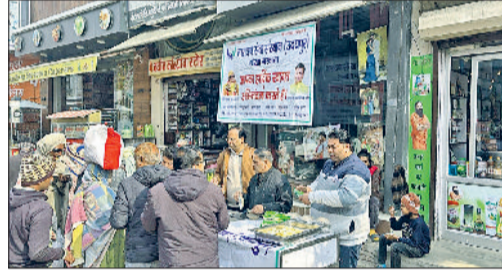
नरवाना। प्रसाद वितरित करते हुए।