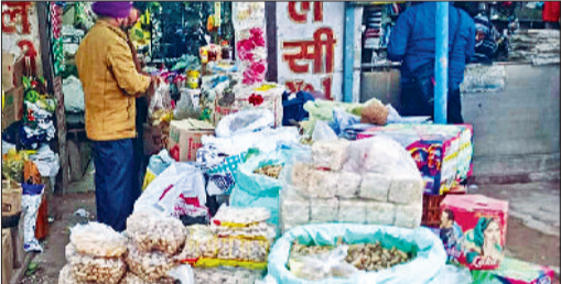
राजौड़। लोहड़ी के दिन रात के समय लोहड़ी जला कर प्रार्थना करते हुए व दुकानों पर सजी हुई मुंगफली रेवड़ियां।

राजौड़। मकर संक्रांति से एक दिन पूर्व मनाए जाने वाले लोहड़ी पर्व को करखा के लोगों ने धूमधाम से मनाया। पर्व को लेकर हर कोई उत्साहित दिखाई दिया। लोहड़ी की खरीददारी को देखते हुए बाजारों में जगह-जगह मूंगफली, रेवड़ी व गजक की रेडियां सजी हुई थीं। मंगलवार को लोहड़ी पर लोगों ने मूंगफली व रेवड़ी की खूब खरीददारी कर उपहार के रूप में एक दूसरे को भेंट दी। करखा में अनेक स्थानों पर लोहड़ी उत्सव को रंगारंग तरीके से मनाने के लिए युवाओं ने डीजे की थाप पर जमकर धमाल मचाया। लोहड़ी पर्व व मकर संक्रांति पर्व को देखते हुए बाजारों में खूब रहल पहल उभर पड़ी। वहीं वस्त्रों एवं श्रृंगार के सामान की दुकानों पर महिलाओं की भीड़ रह गई। दिन भर लोहड़ी की खुशी बांटने के लिए आपस में मूंगफली, रेवड़ी व मिठाइयां बांटी गईं। सांघ को लोगों ने अपने घरों में अलावा जिलाकर उसकी परिक्रमा कर कर की सुख शांति की कामना की। आधुनिकता की मार के चलते बच्चों की टोलियां लोहड़ी मांगने के लिए गली-गली घूमते अब नहीं दिखाई देते, जबकि कुछ वर्ष पूर्व में छोटी-छोटी लड़कियां लोहड़ी के दिन तिली हरी व पपी, तिली मोतियां जड़ी, तिली ओस चेंडे जा जित्ते गुग्गे दा ब्याह वाले गीत गुनगुनाती हुई उन घरों में लोहड़ी मांगने जाती थीं जिन घरों में लड़के का जन्म हुआ होता था या लड़के की शादी के बाद पहली लोहड़ी होती थी। इसी तरह छोटे बच्चे भी टोलियां बनाकर दुकान भूरी जाता हो, दुकाने की ब्याही हो जैसे गीत गाकर इस पर्व की खुशी मनाते थे, परंतु अब लोहड़ी को लेकर एक दिन पहले ही मोबाइल फोन पर एसएमएस का दौर शुरू हो जाता है। अब तो लड़के व लड़कियां भी लोहड़ी मांगने में शर्म महसूस करते हैं।