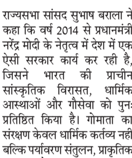
हरिभूमि न्यूज ▶▶ जीद

संवैधिक कोष से 25 लाख रुपये देने की घोषणा राज्यसभा सांसद सुभाष बराला ने कहा कि वर्ष 2014 से प्रधानमंत्री नरेंद्र मोदी के नेतृत्व में देश में एक ऐसी सरकार कार्य कर रही है, जिसने भारत की प्राचीन सांस्कृतिक विरासत, धार्मिक आस्थाओं और गौसेवा को पुनः प्रतिष्ठित किया है। गोमाता का संरक्षण केवल धार्मिक कर्तव्य नहीं बल्कि पर्यावरण संतुलन, प्राकृतिक संरक्षण और सामाजिक समरसता से भी गहराई से जुड़ा हुआ है। राज्यसभा सांसद सुभाष बराला मंगलवार को जयंती देवी मंदिर के सामने स्थित नदीशाला समिति द्वारा आयोजित कार्यक्रम में मुख्यअतिथि संबोधित कर रहे थे। नदीशाला के विकास एवं गौरसंरक्षण कार्यों के लिए संवैधिक कोष से 25 लाख देने की घोषणा की। कहा कि मुख्यमंत्री नायब सैनी के नेतृत्व में प्रदेश सरकार चहुंमुखी विकास के साथ-साथ गोमाता के संरक्षण को सर्वोच्च प्राथमिकता दे रही है।