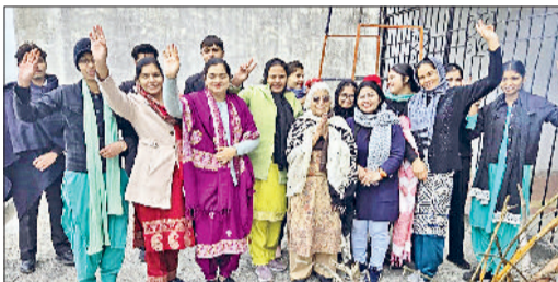
सीवन। सीवन के परम ज्योति स्कूल ऑफ नर्सिंग में लोहड़ी मनाती छात्राएं।