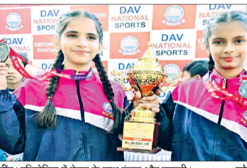
जीद। प्रतियोगिता में मेडल के साथ एंजल और मनरवी।