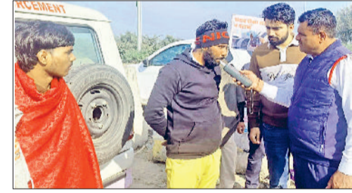
जीद। चालकों की जांच करते ट्रैफिक पुलिसकर्मी।