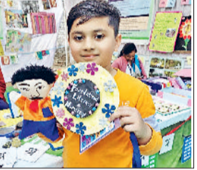
जीद। गतिविधि में भाग लेते हुए बच्चे।

जिले के 423 प्राथमिक विद्यालयों में पहली से तीसरी कक्षा के विद्यार्थियों का गत 29 व 30 दिसंबर को दो दिवसीय संसद गुपिंग असेसमेंट हुआ था। इसमें से 200 स्कूल कैटेगरी, 168 स्कूल बी और 53 स्कूल सी कैटेगरी में शामिल हुए थे। पिछली बार की तुलना में इस बार परिणाम में सुधार हुआ है। दूसरी कक्षा में 74.5 प्रतिशत की जगह अब 82.8 प्रतिशत और तीसरी कक्षा में 65.9 प्रतिशत की जगह 78.1 प्रतिशत विद्यार्थी निपुण बने हैं। असेसमेंट में विद्यार्थियों से हिंदी